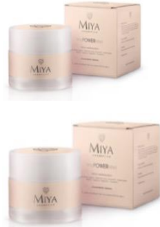
myPOWERelixir Tratamiento de rostro, ojos y labios