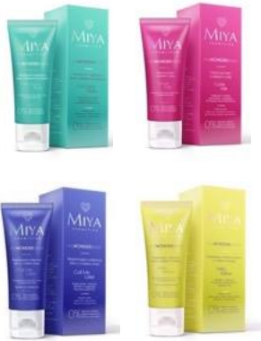
myWONDERBalm Crema de rostro y ojos