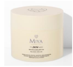
mySKINhero Exfoliante de rostro y cuerpo