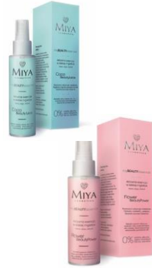
myBEAUTYessence Esencia facial