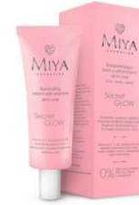
SecretGLOW Crema de rostro y ojos