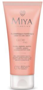
GLOWme Crema corporal